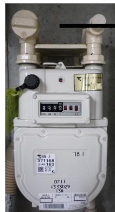
メーターの「三元栓」